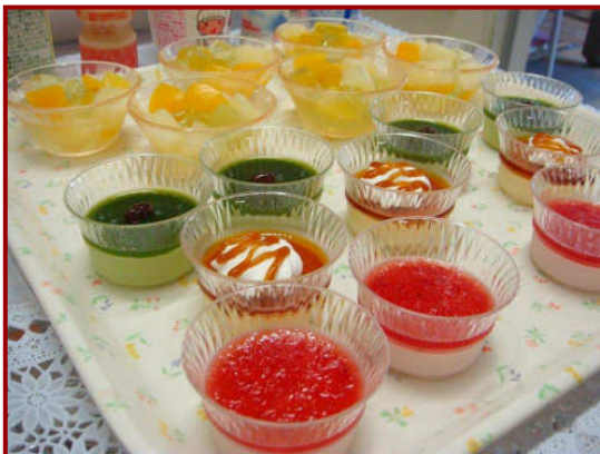
色鮮やかなデザート類