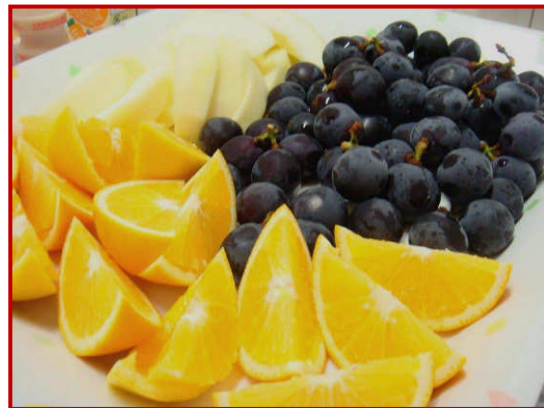
季節のジューシーな果物