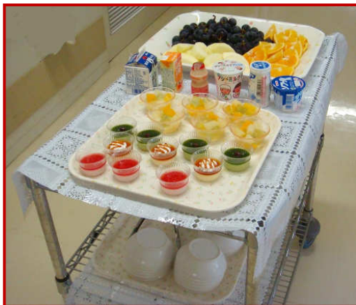
ワゴンに満載の果物、飲み物、デザート類。目移りしそう・・・(^_^)