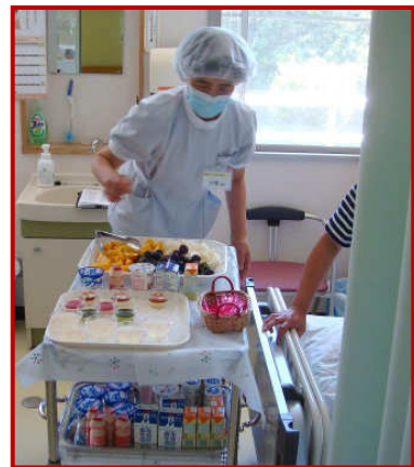
選んでいただいたものをその場でお渡しいたします