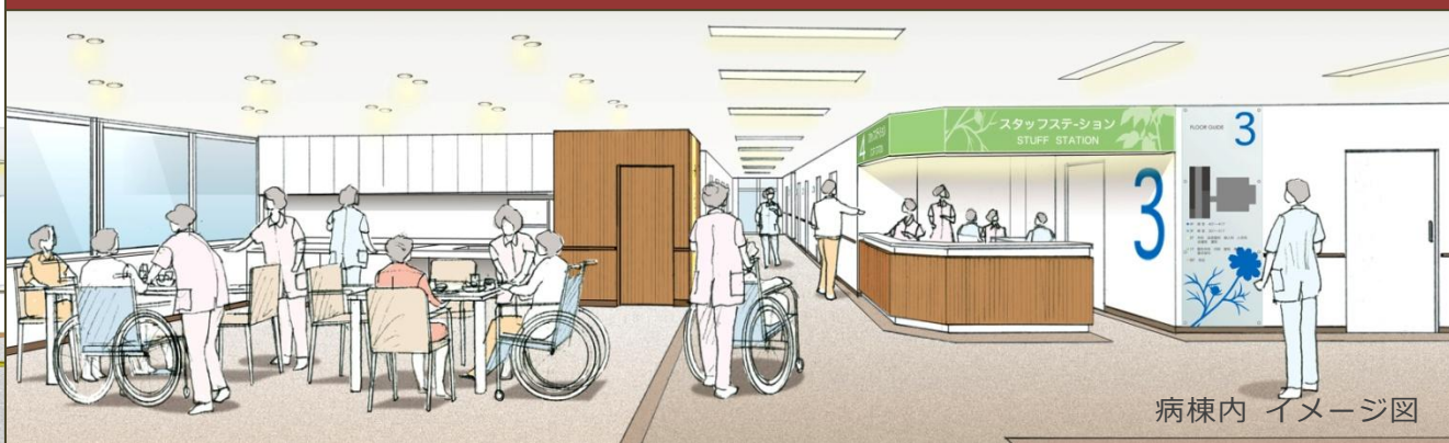
病棟内 イメージ図