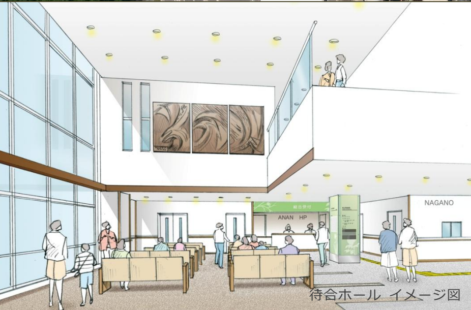
待合ホール イメージ図