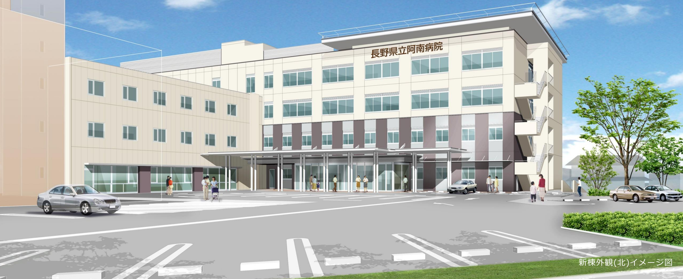
新棟外観(北)イメージ図