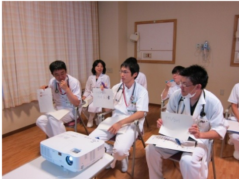
研修医スキルアップセミナー 「最終診断は？」