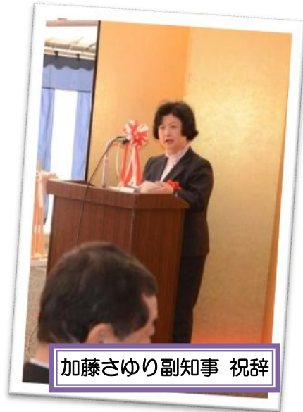
加藤さゆり副知事 祝辞