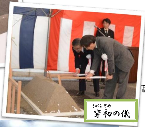
うちらぞめ 穿初の儀