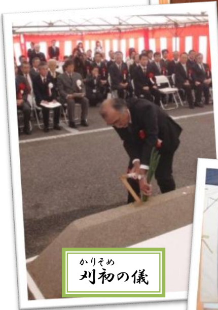
かりそめ 刈初の儀